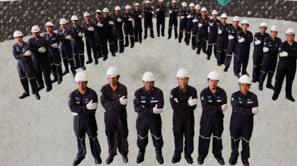
ทีมบริการหลังการขาย พร้อม